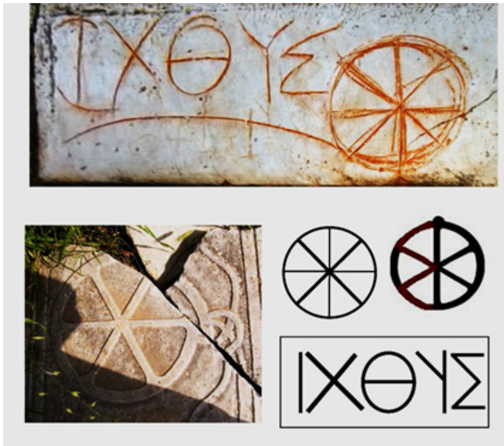
Picture 4. Stone monument found in the ruins of Ephesus