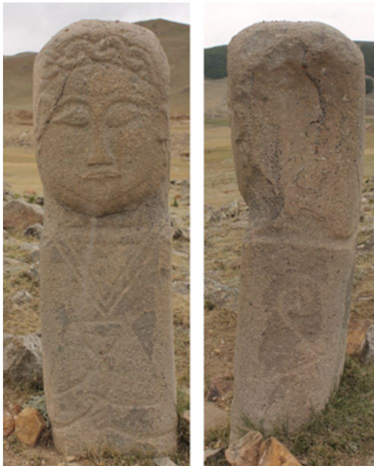
Picture 2. Current condition of Saadag Khairkhan deer statue

The monument is now upright in front of Zagastai pass on the left-hand side of the great road, on the left side of one of the two railing stone curb parallel to the Turkic period monument fenced with an iron curb (picture 2).