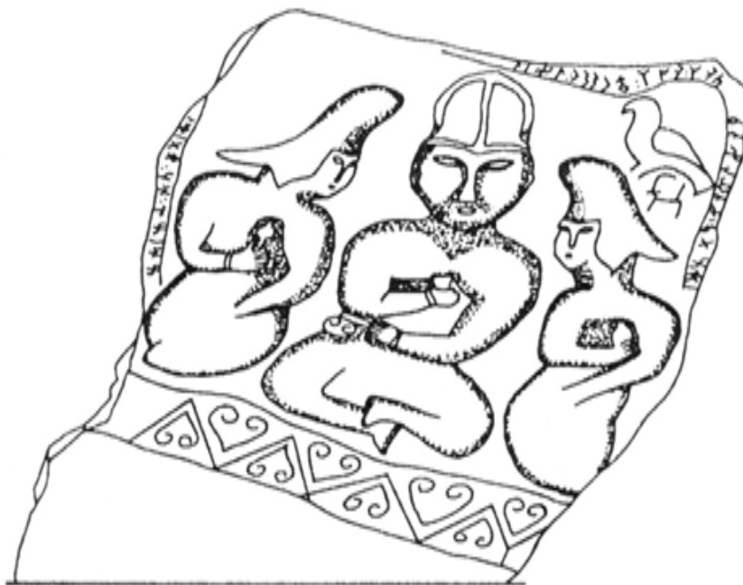
Рис. 3. Мемориал Асхете. Плита с поминальным пиром (по Войтову, 1996, с. 111, рис. 67)

Широко известная плита подобного каменного ящика в Асхете также несет явные следы вторичного, возможно, неоднократного посещения и использования (Радлов, 1892: табл. XV, 2, XXVI, 3; 1896, табл. LXXXIV, 1, 2; Кызласов Л.Р., 1964: 34, рис. 2; Войтов, 1996: рис. 67).