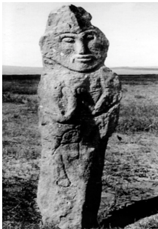
Рис. 2. Мемориал Кошо-Цайдам III. Изваяние 2 (по М. Жолдасбекову, К. Сарткожаулы, Атлас. 2006, с. 210, илл. 158)

Подобную ситуацию встречаем и в значительно более простом мемориальном комплексе Кошо-Цайдам III, где перед оградкой из высоких плит («саркофагом») ныне сохранилось 3 антропоморфных изображения и фигура барана. Наряду с двумя объемными скульптурами (2005: 206, 207, 210, сур. 1, 2, 6; 2006: илл. 157, 161) и изваянием стоящего человека, выполненном в иной манере (2005: 208, 209, сур. 3-5; 2006: илл. 160), здесь вкопана и простая каменная баба с изображением одного лишь лица и пары прижатых к груди рук (2006: илл. 158) 3 (рис. 2).