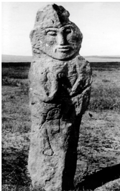
Рис. 2. Мемориал Кошо-Цайдам III. Изваяние 2 (по М. Жолдасбекову, К. Сарткожаулы, Атлас. 2006, с. 210, илл. 158)

Подобную ситуацию встречаем и в значительно более простом мемориальном комплексе Кошо-Цайдам III, где перед оградкой из высоких плит («саркофагом») ныне сохранилось 3 антропоморфных изображения и фигура барана. Наряду с двумя объемными скульптурами (2005: 206, 207, 210, сур. 1, 2, 6; 2006: илл. 157, 161) и изваянием стоящего человека, выполненном в иной манере (2005: 208, 209, сур. 3-5; 2006: илл. 160), здесь вкопана и простая каменная баба с изображением одного лишь лица и пары прижатых к груди рук (2006: илл. 158) 3 (рис. 2).