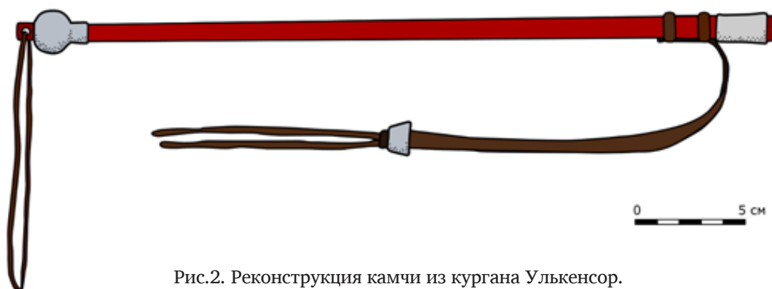
Рис.2. Реконструкция камчи из кургана Улькенсор.

(Серым цветом показаны детали из рога; коричневым цветом вероятное положение ремней; бордовым – рукоять из таволги. Автор реконструкции – С.А. Ярыгин)